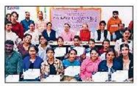
महेंद्रगढ़। बुक कवर डिजाइन प्रतियोगिता में हिस्सा लेने वाले विद्यार्थी।